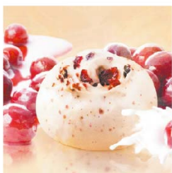
有若 蔓越莓牛奶饅頭 (奶素)