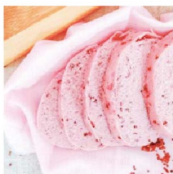
子華 佛卡夏紅藜饅頭 (五辛素)