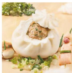
子張 三星蔥鮮肉包 (葷)