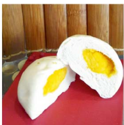
子予 金沙包 (蛋奶素)