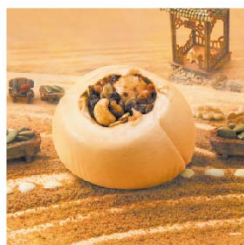
子游 核桃堅果饅頭 (微糖)