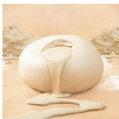
孔子 起司包 (奶素)