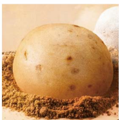
子若 黑糖桂圓饅頭