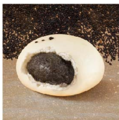
子路 芝麻包 (葷)