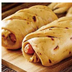
子長 桂圓香腸饅頭 (低糖/葷)