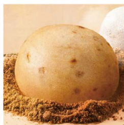
子若 黑糖桂圓饅頭