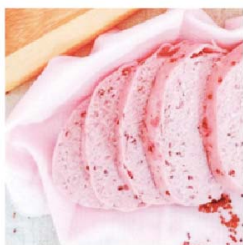
子華 佛卡夏紅藜饅頭 (五辛素)