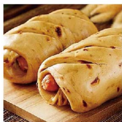
子長 桂圓香腸饅頭 (低糖/葷)