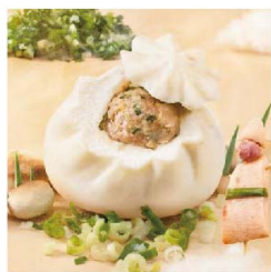
子張 三星蔥鮮肉包 (葷)