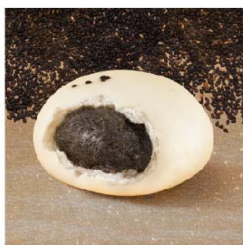
子路 芝麻包 (葷)