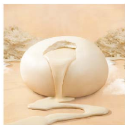
孔子 起司包 (奶素)