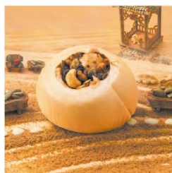
子游 核桃堅果饅頭 (微糖)