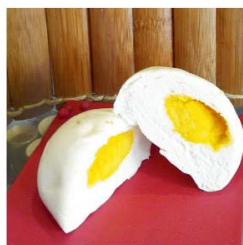
子予 金沙包 (蛋奶素)