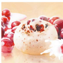
有若 蔓越莓牛奶饅頭 (奶素)